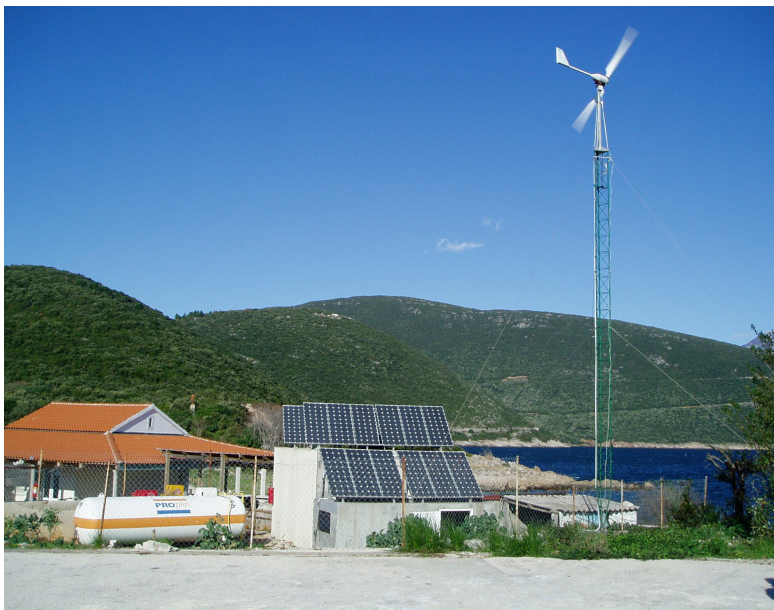
Slika 1. Hibridni sustav – PARK PRIRODE PREVLAKA